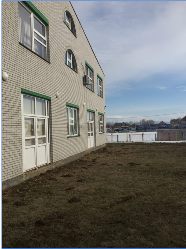
Слика 4. Локација доградње на постојећи објекат