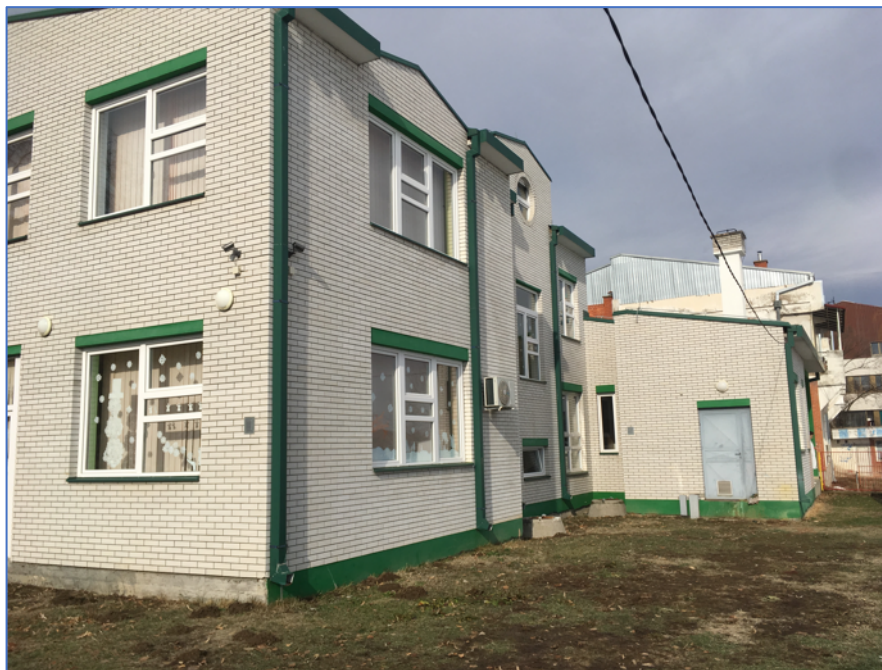
Слика 3. Постојећи објекат

Овим ПЗУЖССО разматра се проширење постојећег објекта као интервенција планирана овим потпројектом, без потребе за реновирањем постојећег објекта или сличних радова на њему.