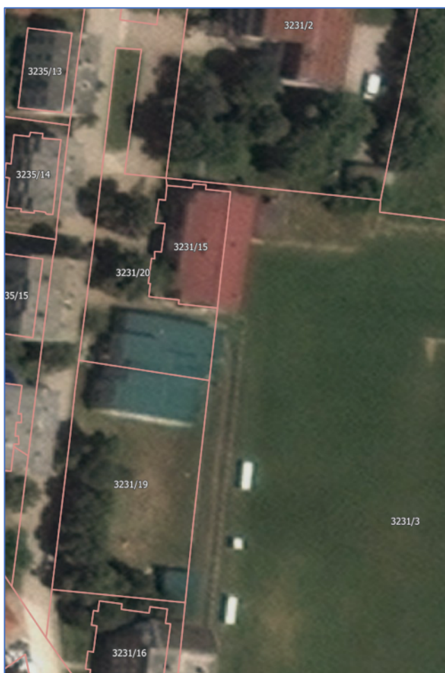
Слика 2. Поглед из ваздуха на парцеле бр. 3231/19 и бр. 3231/20, на којима се налази предвиђени потпројекат