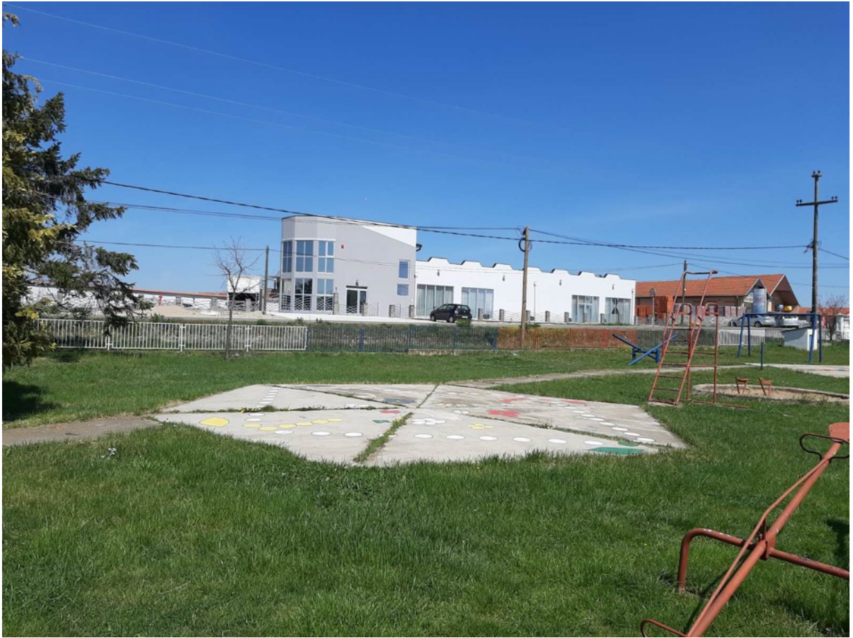
Slika 3 - Prikaz planiranog objekta