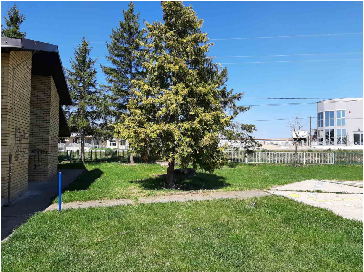
Slika 2 - Prikaz planiranog objekta