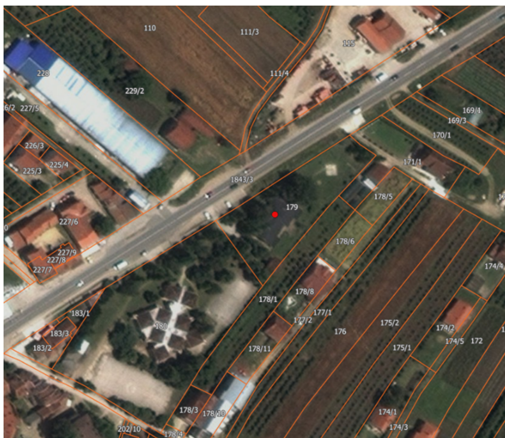
Slika 1 - Pogled iz vazduha na parcelu br. 179 K.O. Merošina, na kojoj će se nalaziti planirani objekat