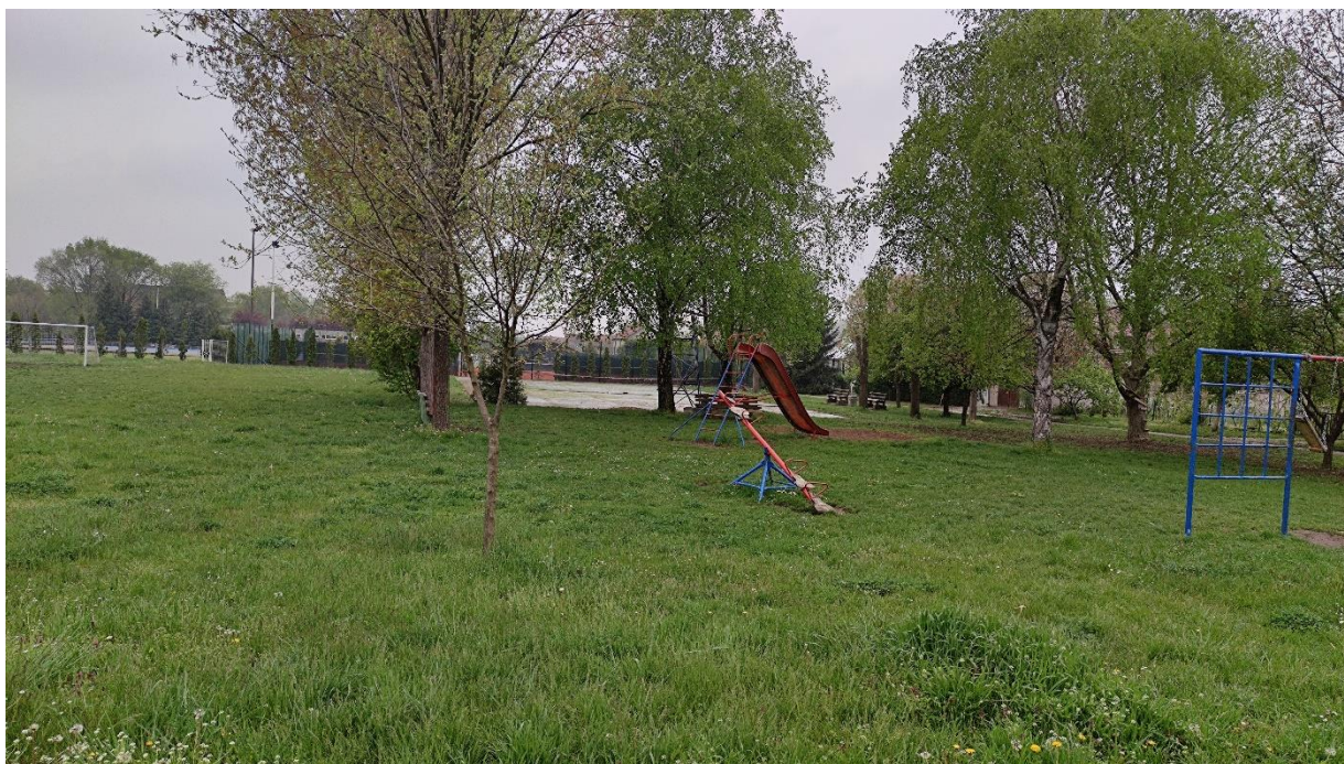
Slika 5 - Prikaz lokacije na kojoj je planirana izgradnja objekta