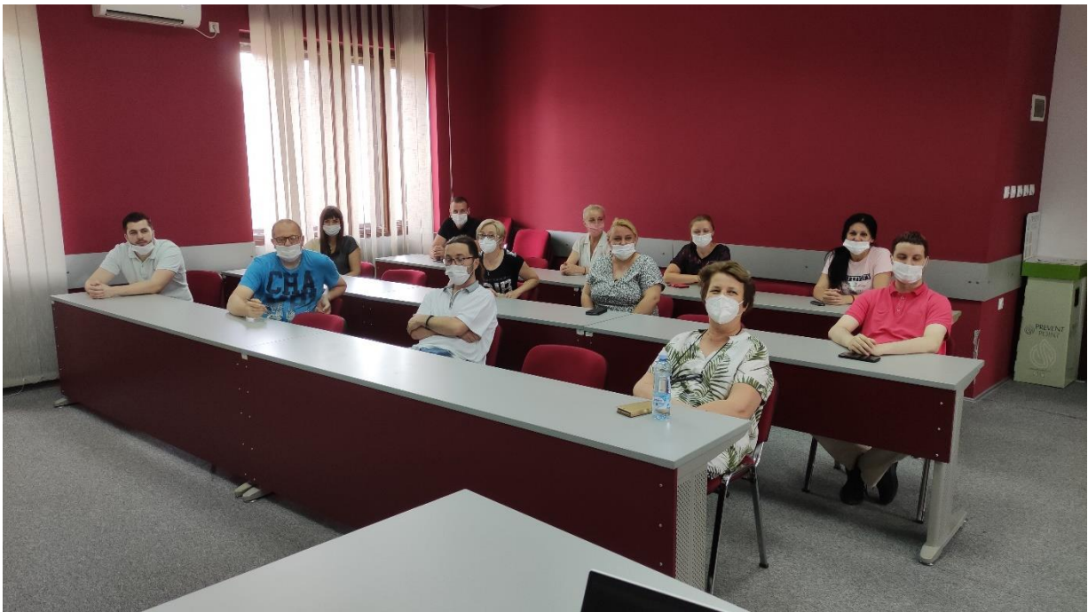
Slika 7 - Fotografija snimljena tokom prezentacije uz dozvolu za objavljivanje

Javna rasprava je okončana u 13.30h po lokalnom vremenu.