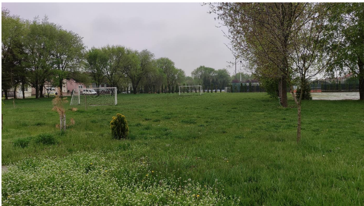
Slika 2 - Prikaz lokacije na kojoj je planirana izgradnja objekta

Ovim PzUŽSSO razmatra se izgradnja novog objekta kao intervencija planirana ovim potprojektom.