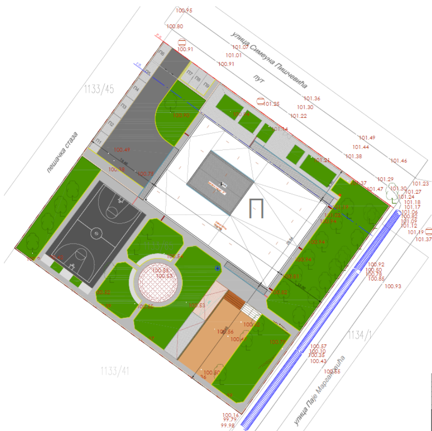
Slika 6 - Položaj planiranog objekta