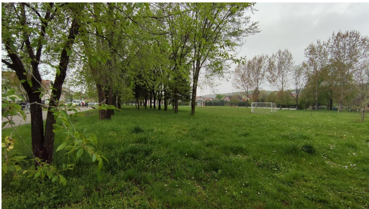
Slika 4 - Prikaz lokacije na kojoj je planirana izgradnja objekta