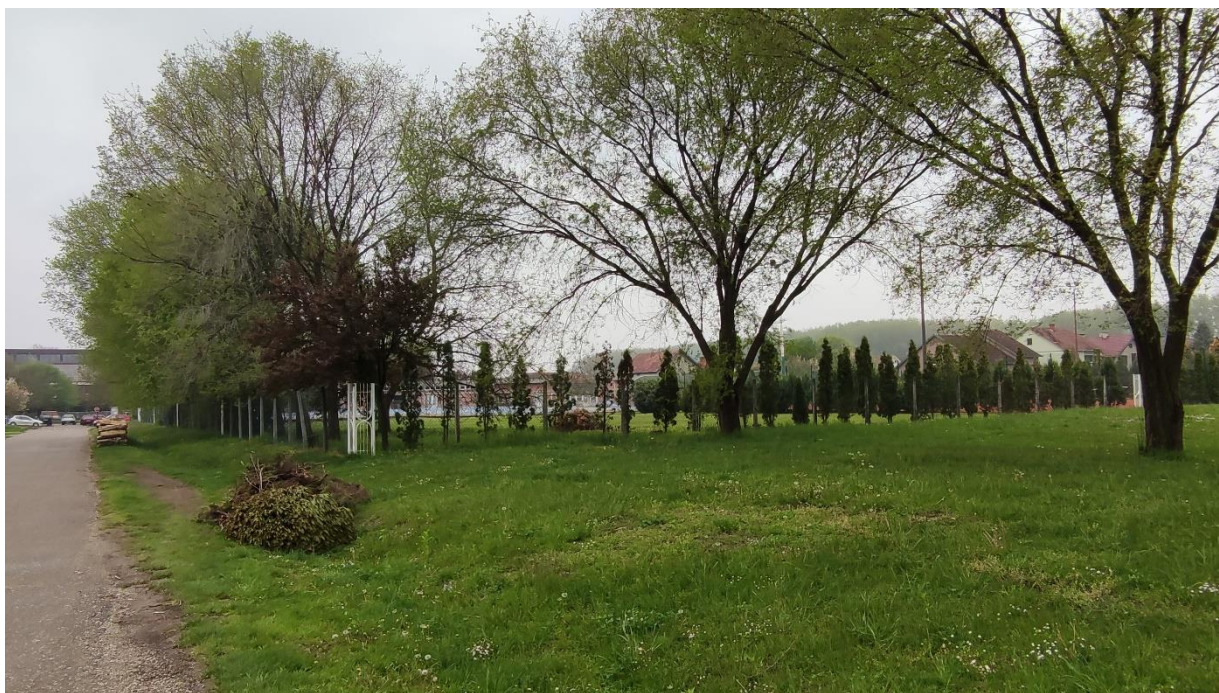
Slika 3 - Prikaz lokacije na kojoj je planirana izgradnja objekta