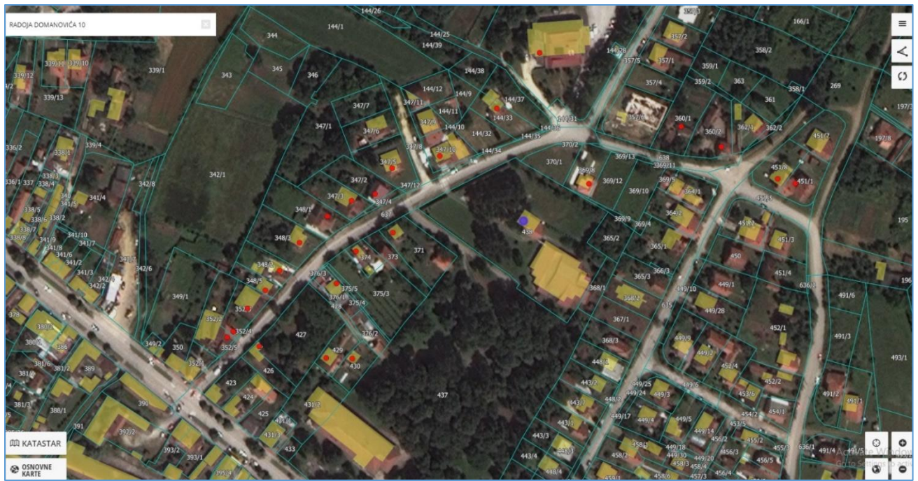
Lokacija KP br. 438 KO Rača