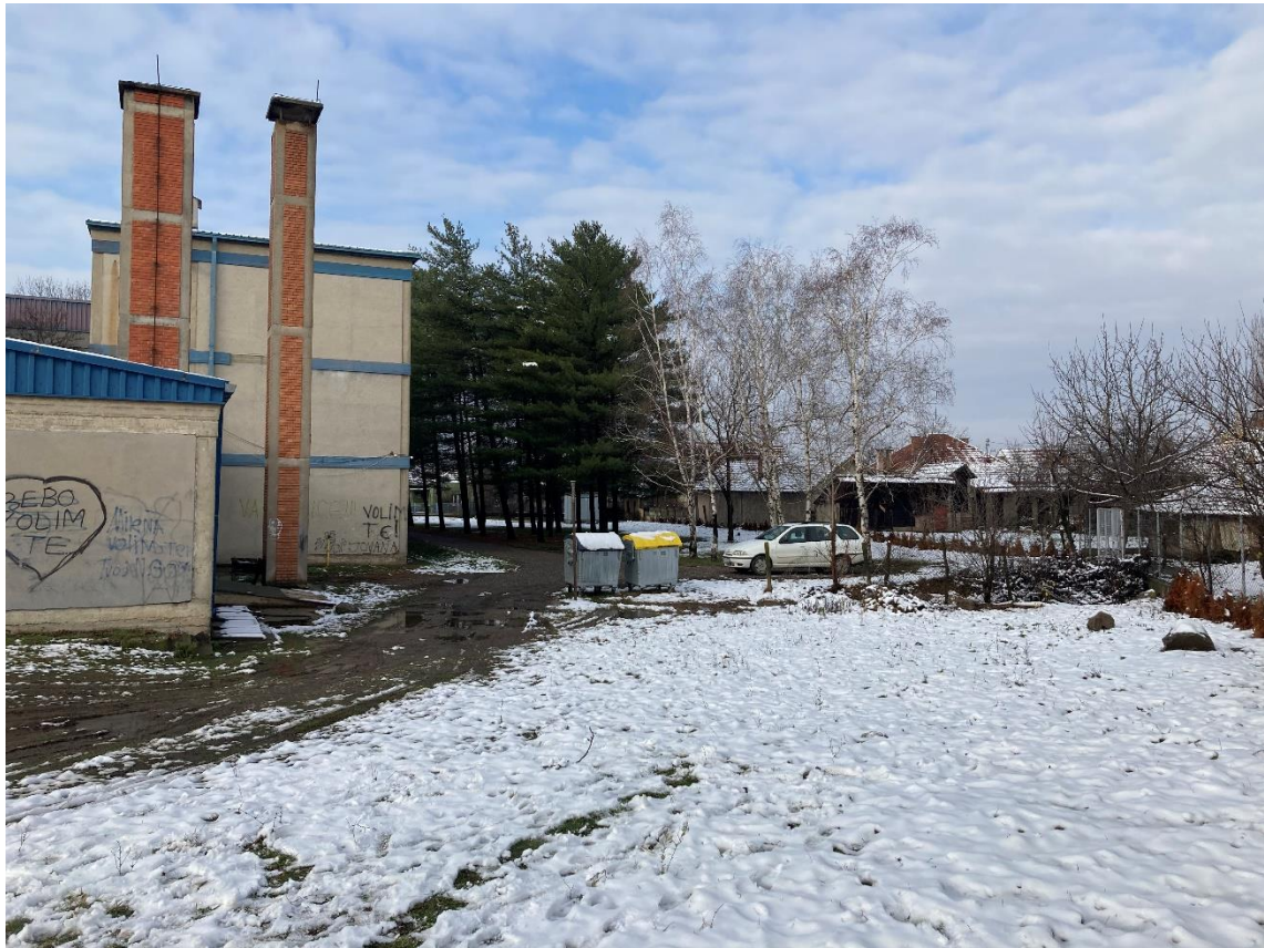
Slika 5 - Prikaz lokacije na kojoj je planirana izgradnja objekta