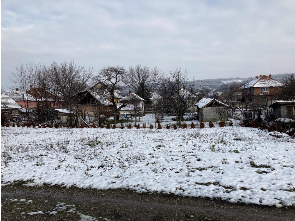
Slika 3 - Prikaz lokacije na kojoj je planirana izgradnja objekta