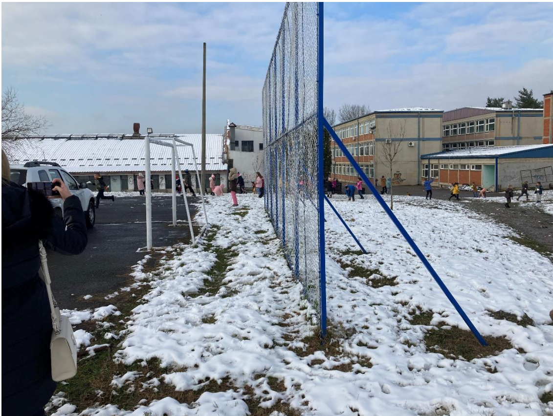
Slika 4 - Prikaz lokacije na kojoj je planirana izgradnja objekta, Stražavačka reka