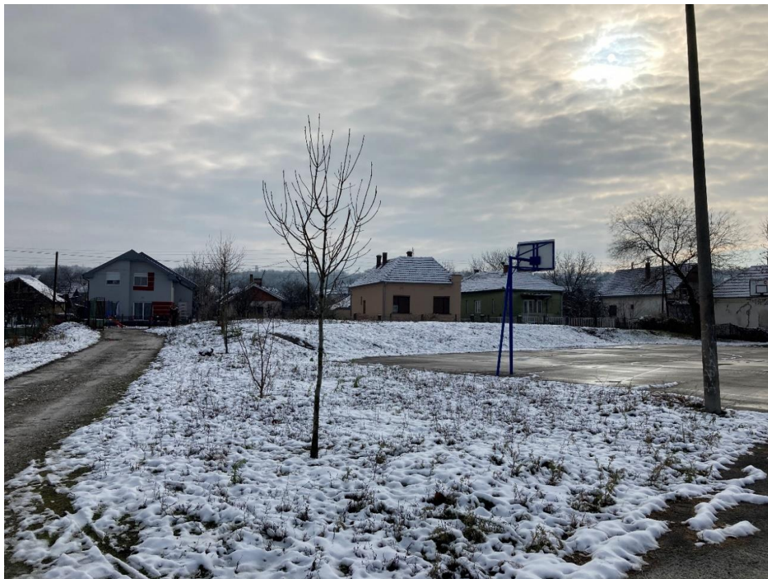
Slika 2 - Prikaz lokacije na kojoj je planirana izgradnja objekta

Ovim PzUŽSSO razmatra se izgradnja novog objekta kao intervencija planirana ovim potprojektom.