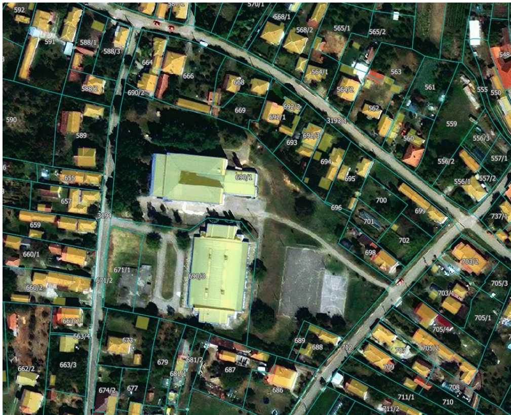
Slika 1 - Pogled iz vazduha na parcelu br. 690/1 KO Čićevac - grad, na kojoj će se nalaziti planirani objekat