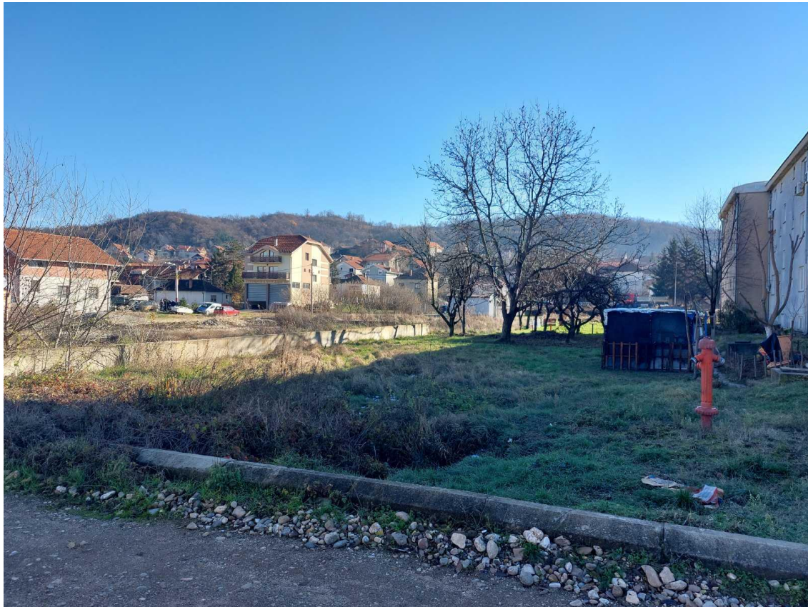
Slika 4 - Prikaz lokacije na kojoj je planirana izgradnja objekta