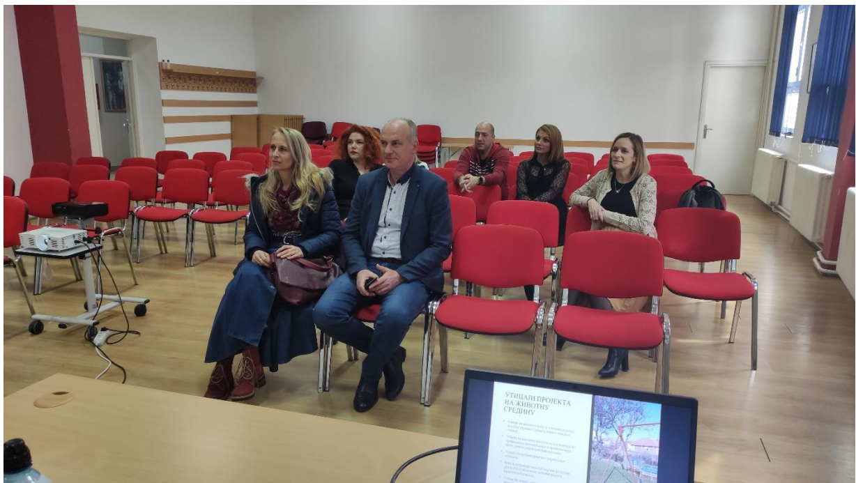
Slika 9 - Fotografija snimljena tokom prezentacije uz dozvolu za objavljivanje

Javna rasprava je okončana u 12.30h po lokalnom vremenu.