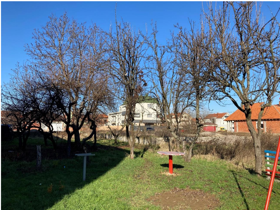
Slika 3 - Prikaz lokacije na kojoj je planirana izgradnja objekta