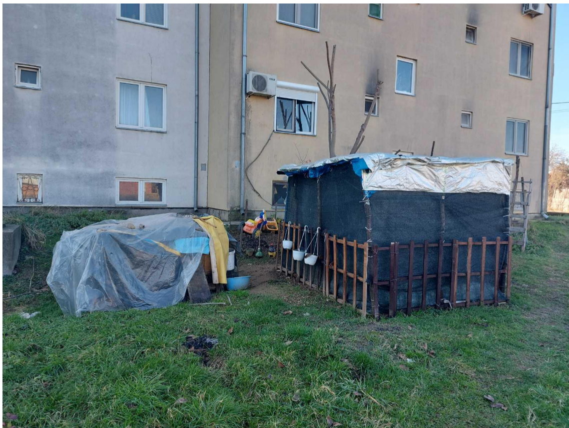
Slika 7 - Prikaz lokacije na kojoj je planirana izgradnja objekta