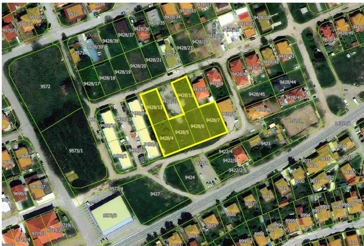
Slika 1 – Pogled iz vazduha na parcele br. 9428/4, 9428/5, 9428/6, 9428/7, 9428/11 i 9428/13 KO Leskovac, grad Leskovac, na kojima će se nalaziti planirani objekat