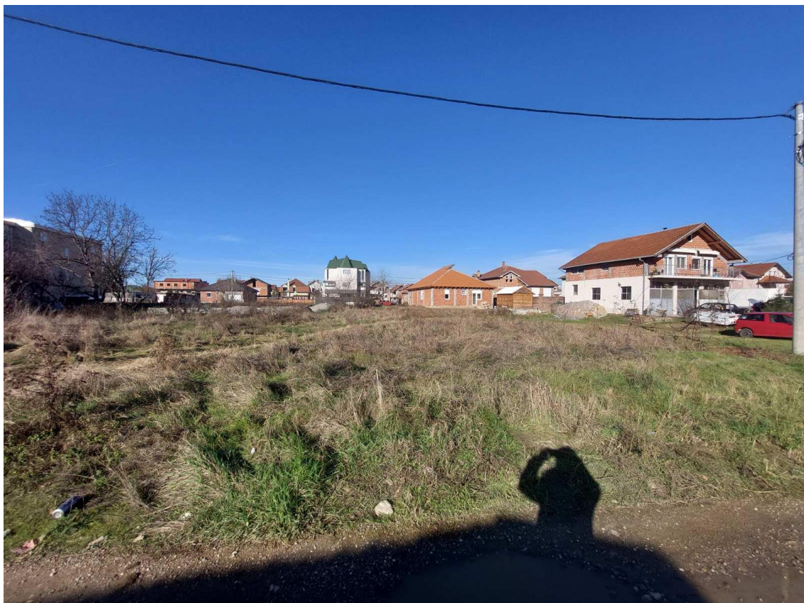
Slika 5 - Prikaz lokacije na kojoj je planirana izgradnja objekta