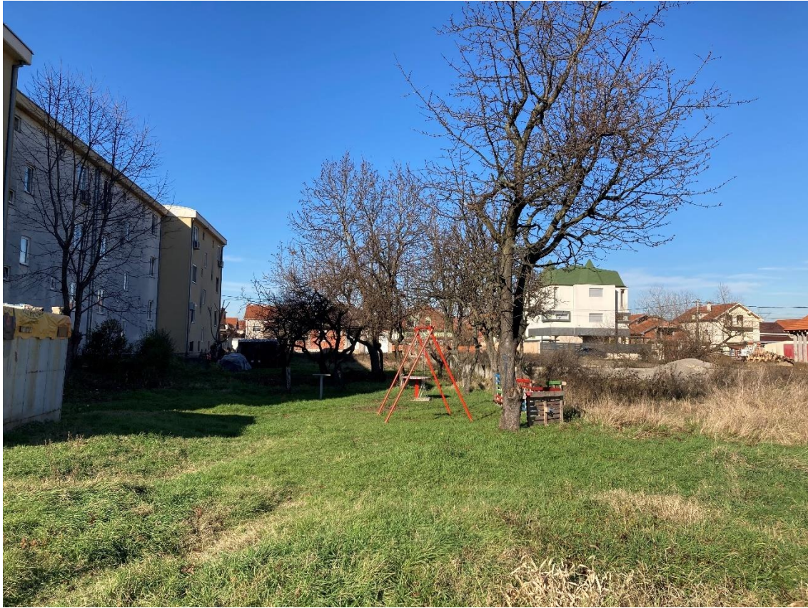
Slika 2 - Prikaz lokacije na kojoj je planirana izgradnja objekta