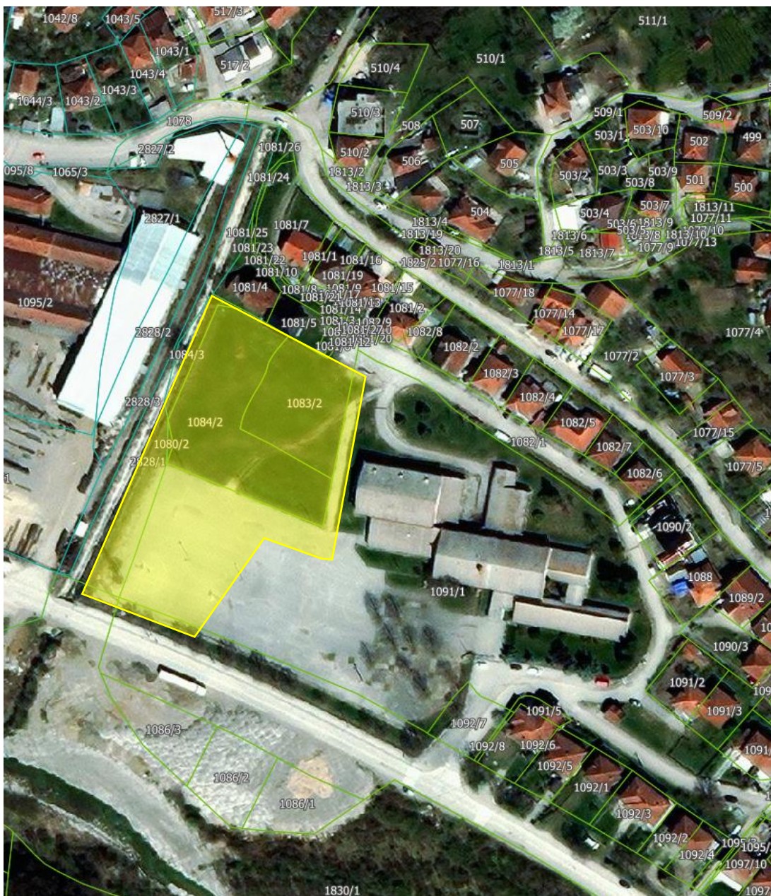
Slika 1 - Pogled iz vazduha na novu parcelu br 1091/6 KO Sedobra, na kojoj će se nalaziti planirani objekat

Parcela 1091/6 KO Sedobra-Prijepolje je nastala od više katastarskih parcela kako bi ispunjavala uslove da bude parcela za izgradnju dečijeg vrtića. Da bi ispunila uslove i formirala se pomenuta parcela bilo je potrebno preraspodeliti površine osnovne škole „Sveti Sava” čija je ukupna površina iznad normativa za osnovno obrazovanje. Nova parcela je tako oformljena da ne remeti funkcionisanje osnovne škole niti umanjuje kvalitet korišćenja sportskih terena ispred škole.