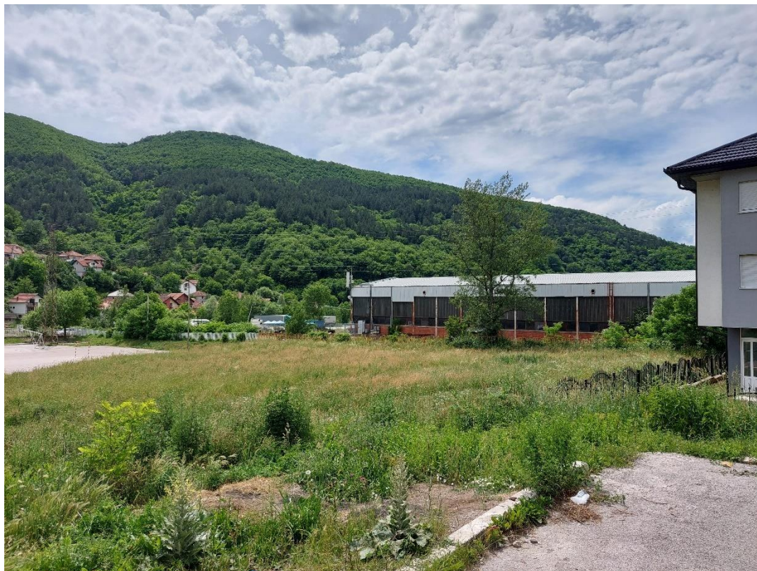
Slika 2 - Prikaz lokacije na kojoj je planirana izgradnja objekta

Ovim PzUŽSSO razmatra se izgradnja novog objekta kao intervencija planirana ovim potprojektom.