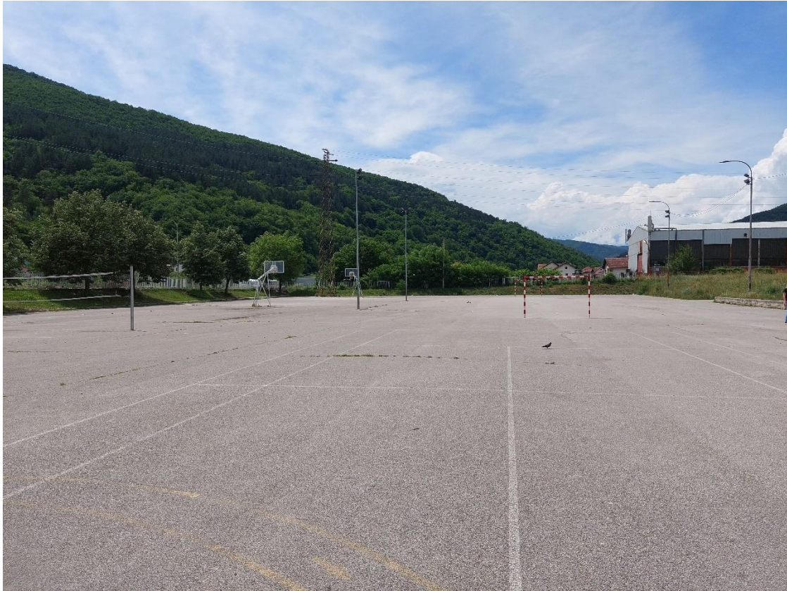
Slika 5 - Prikaz lokacije na kojoj je planirana izgradnja objekta