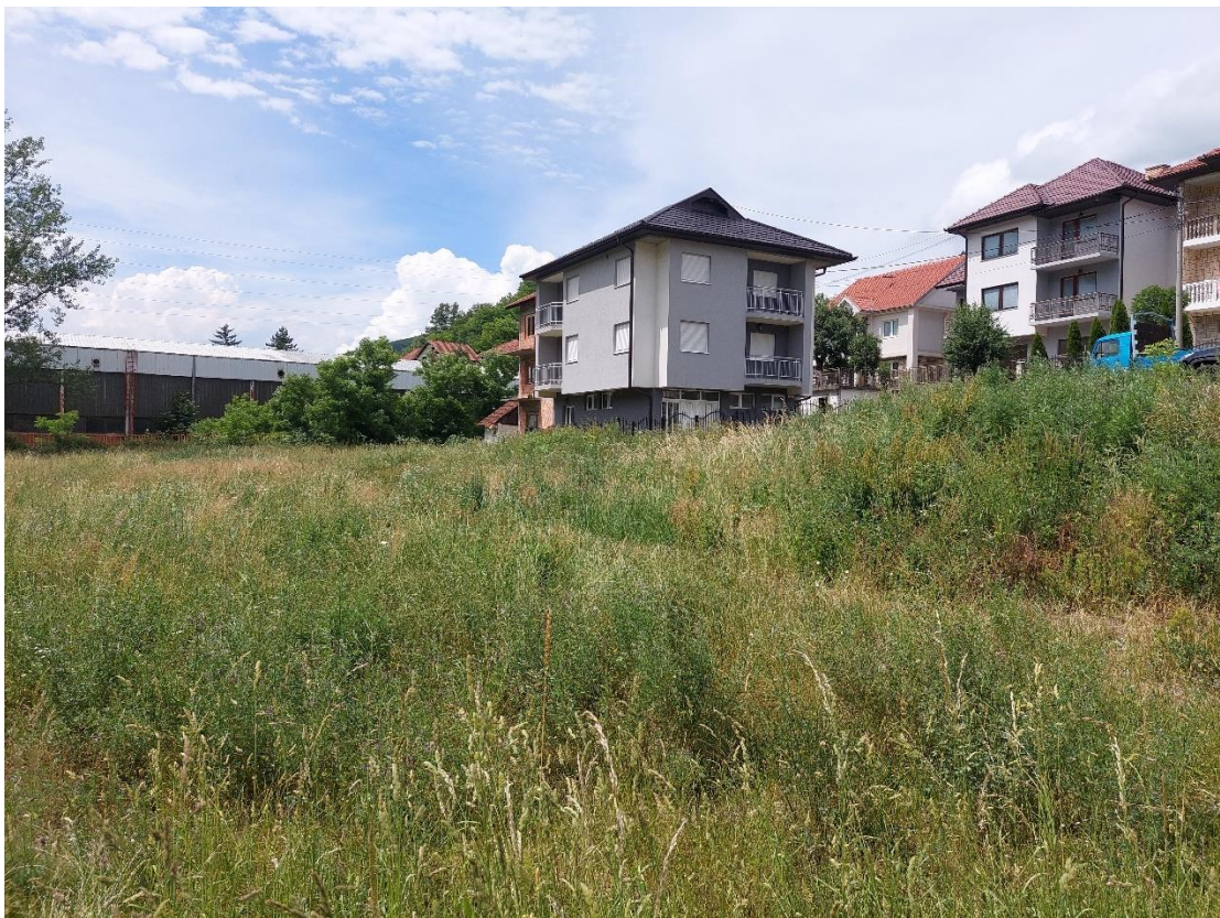
Slika 4 - Prikaz lokacije na kojoj je planirana izgradnja objekta