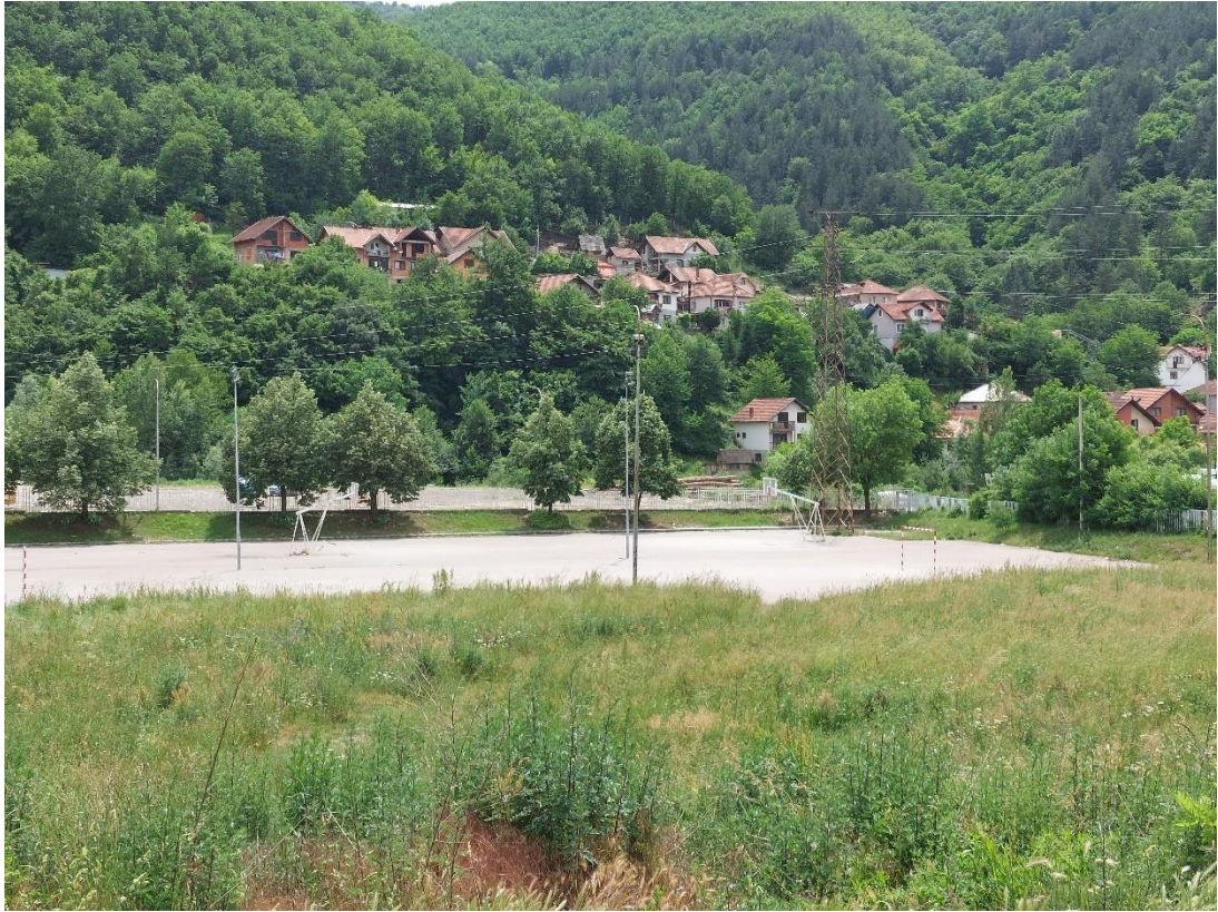
Slika 3 - Prikaz lokacije na kojoj je planirana izgradnja objekta