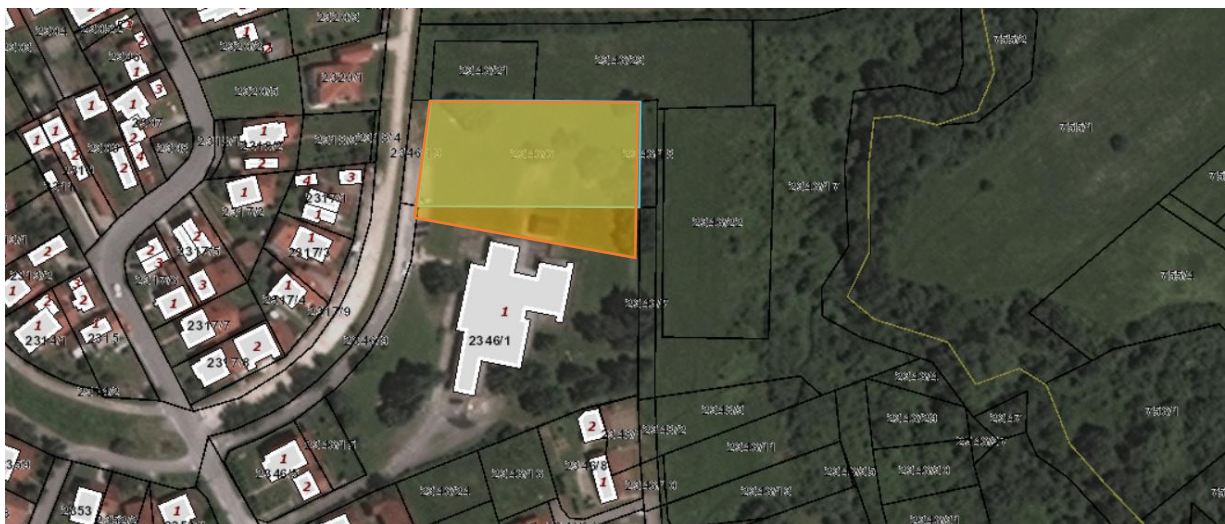
Slika 1 - Pogled iz vazduha na deo k.p. 2346/1 i deo k.p. br 2346/6 KO Arandjelovac, na kojoj će se nalaziti planirani objekat

Projektom je predviđena izrada trotoara kao i popločavanje pločama. Izrada rampe sa odgovarajućom ogradom u cilju pristupačnosti objekta. Zelene površine tretiraće se u cilju postizanja adekvatnih estetskih kriterijuma – nova trava. Postavljanje nedostajućeg mobilijara za boravak dece na otvorenom izvršiće se na mestu na kom se trenutno nalazi mobilijar predškolske ustanove „Sunce” koji će biti uklonjen u celosti. Planirano je da novopostavljeni mobilijar, koji će zadovoljavati sve važeće standarde, zajednički koriste obe ustanove.