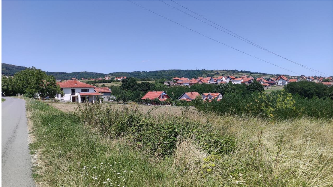
Slika 4 - Prikaz lokacije na kojoj je planirana izgradnja objekta