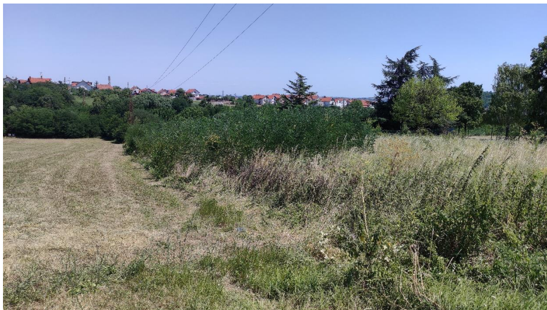
Slika 3 - Prikaz lokacije na kojoj je planirana izgradnja objekta