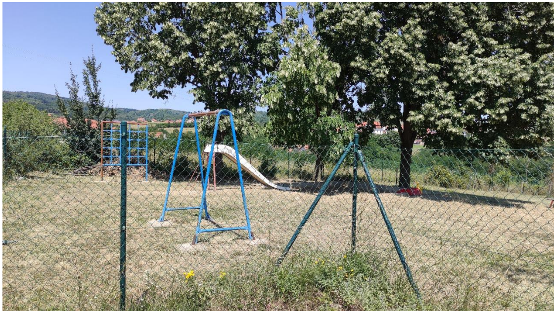
Slika 5 - Prikaz lokacije na kojoj je planirana izgradnja objekta