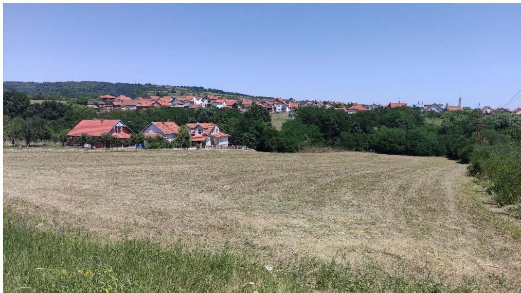
Slika 2 - Prikaz lokacije na kojoj je planirana izgradnja objekta

Ovim PzUŽSSO razmatra se izgradnja novog objekta kao intervencija planirana ovim potprojektom.