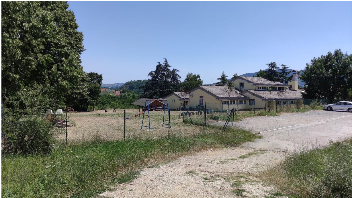
Slika 6 – Prikaz lokacije na kojoj je planirana izgradnja objekta